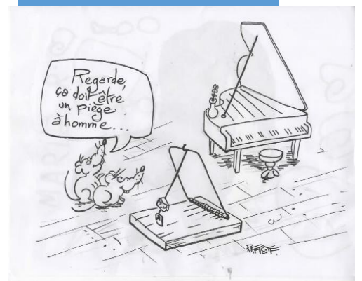
Illustration : Yann Pannaux

Suivez l'actualité du conservatoire sur notre site